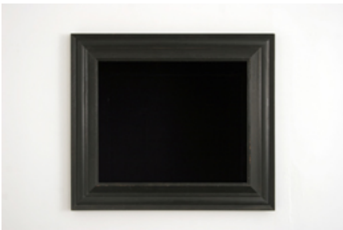
Sans titre, 2008

Bois, plexiglass, peinture, polyuréthane, éclairage, télescope, 600 x 200 x 200 cm.