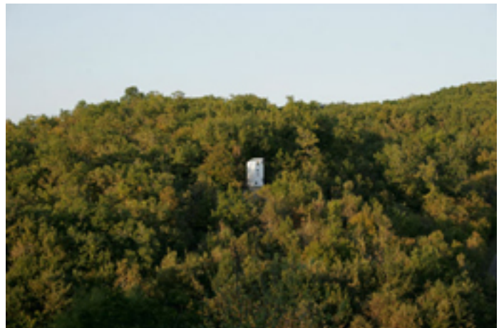
Vérité et mensonge de l'objet figuré géométrique, 2008

Installation. Défenses d'accostage, charbon, banches métalliques. Production Le SPOT, Le Havre.